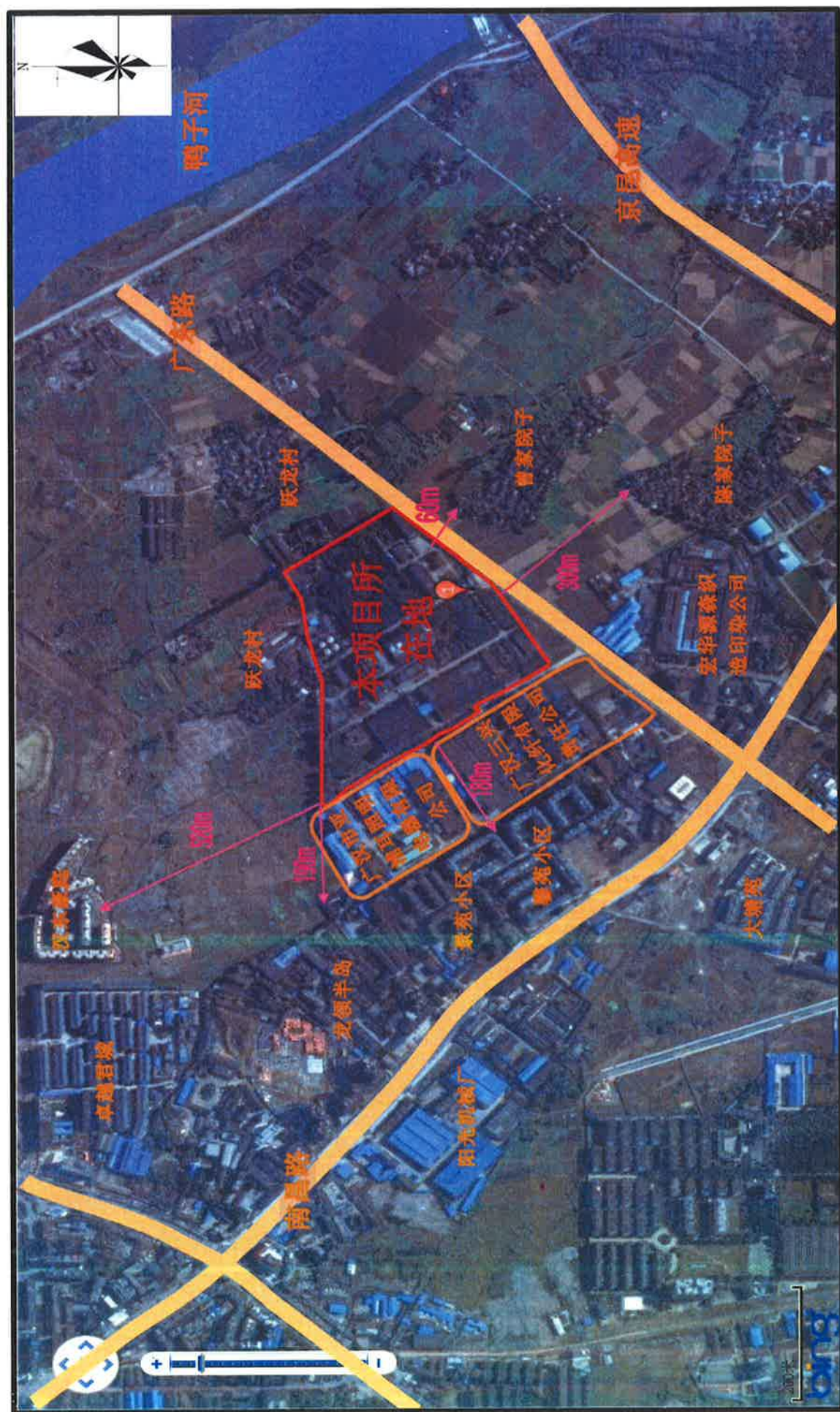
附图3 项目外环境关系图